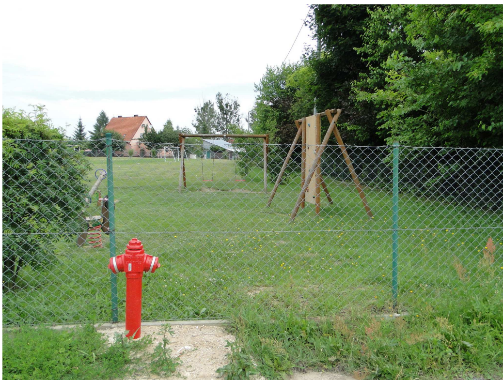
1.Stan obecny zainwestowania działki 2013 , w miejscu wejścia do projektowanej świetlicy