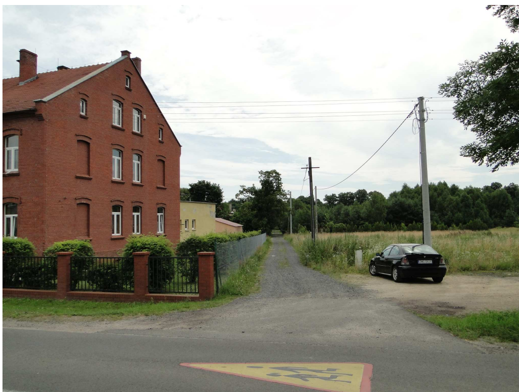
2.Ulica szkolna wlot z wołowskiej z fragm. istniejącej .szkoły