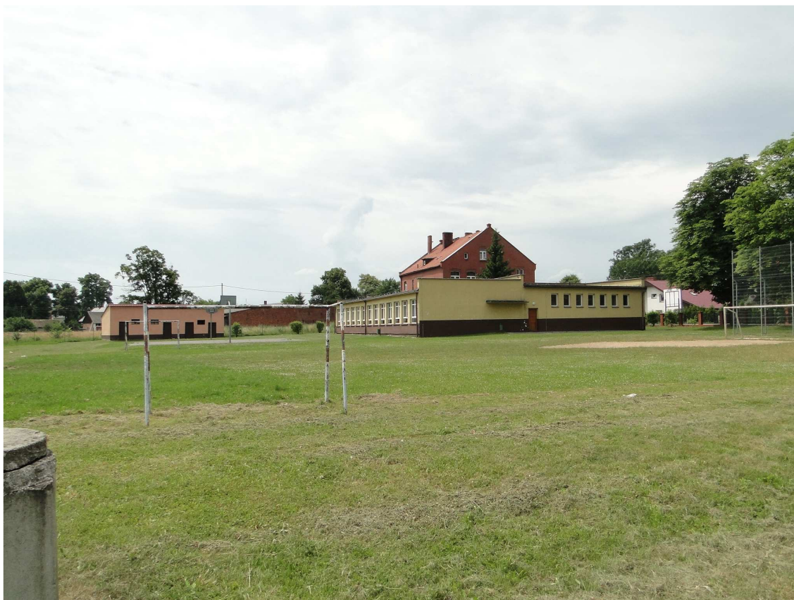
3. Widok z tyłu działki ul Wiśniowa ,budynek do rozbiórki (różowy )